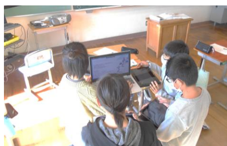
6年生： 松浦小との交流学习