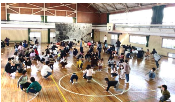
リボン集会：全校で「進化じゃんけん」