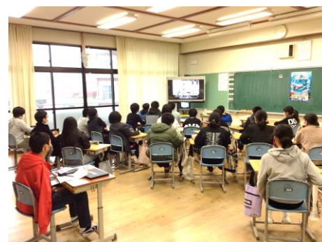
スマホ・ケータイ安全教室：4～6年