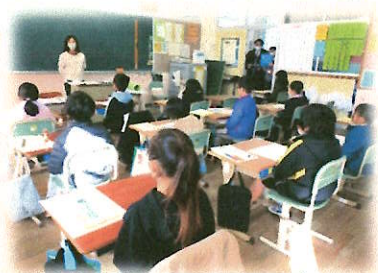
[一分前着席・黙想]