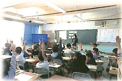
[意欲的な学習態度]