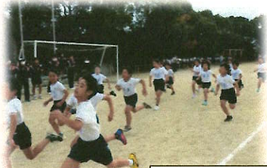
[もちつきマラソン大会]