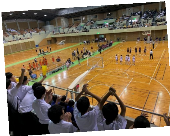
(女子バスケットボール競技応援の様子)