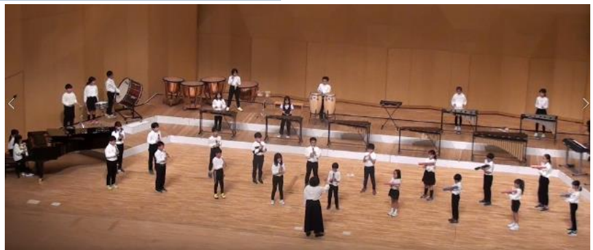
【4年2組合奏：残響散歌】

11月8日に4年生は小学校音楽会に出場しました。3クラスとも素晴らしい演奏をブリックホールいっぱい響かせました。