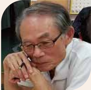
柿泊町自治会 会長

とても面白いアイデアがあふれるほどに出て、「地域の子どもは、地域で守り、地域で育てる！」を実践している手熊小学校区の地域の力を再認識した保護者会となりました。