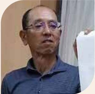
手熊町自治会 会長