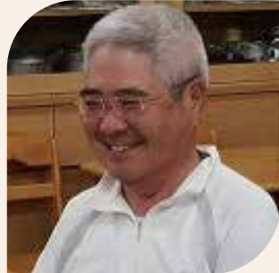
柿泊団地自治会 会長

平日の夜と大変忙しい時間帯にも関わらず、校区内の自治会長さんをはじめ、てぐまっこ学童クラブの園長や小江原中学校区育成協の会長にもご出席いただき、いろんな視点の地域の声をお聞きすることができました。