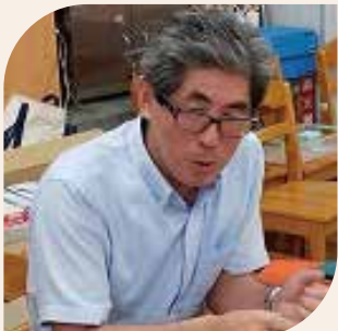
小江原中校区育成協 会長