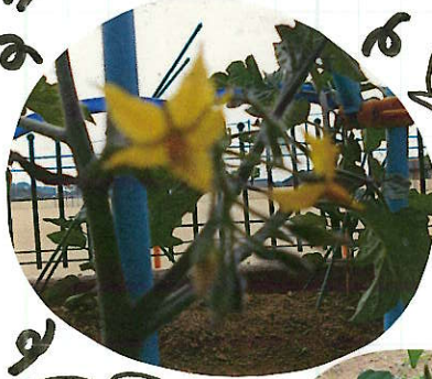
ミニトマトの花が咲きはじめています。