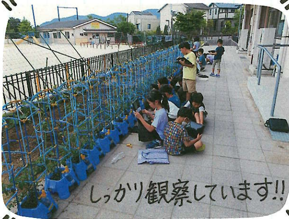
しっかり観察しています!!