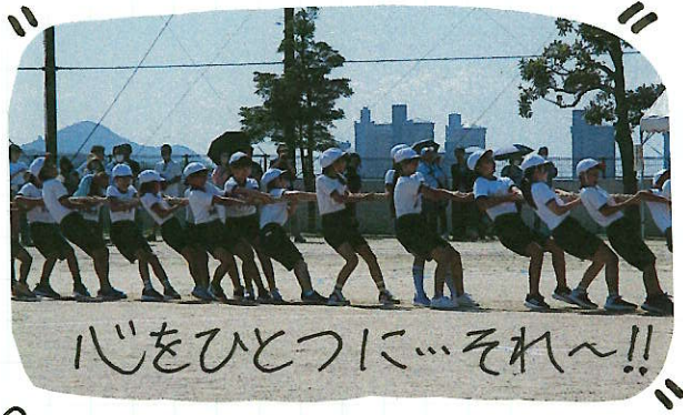
心をひとつに...それ~!!