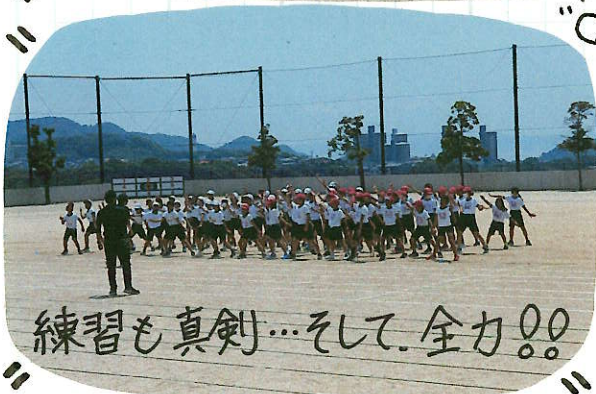
練習も真剣...そして、全カ!!