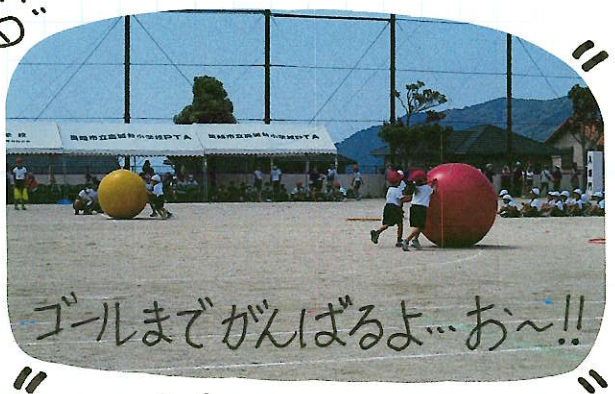
ゴールまでがんばるよ...お~!!