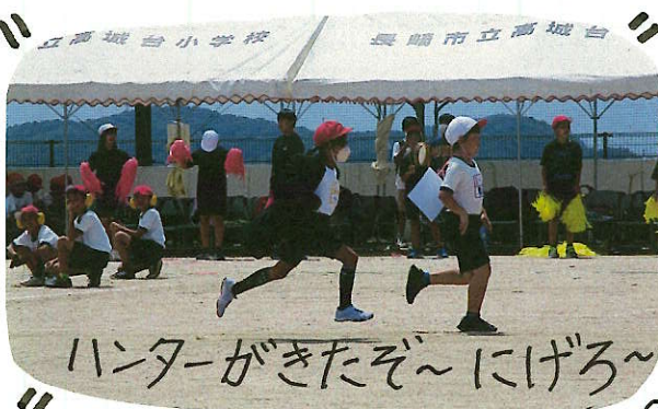
ハンターがきたぞ~にげろ~