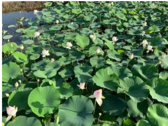
[ 諫早市森山町の唐子湿地公園のハス園の風景です ]