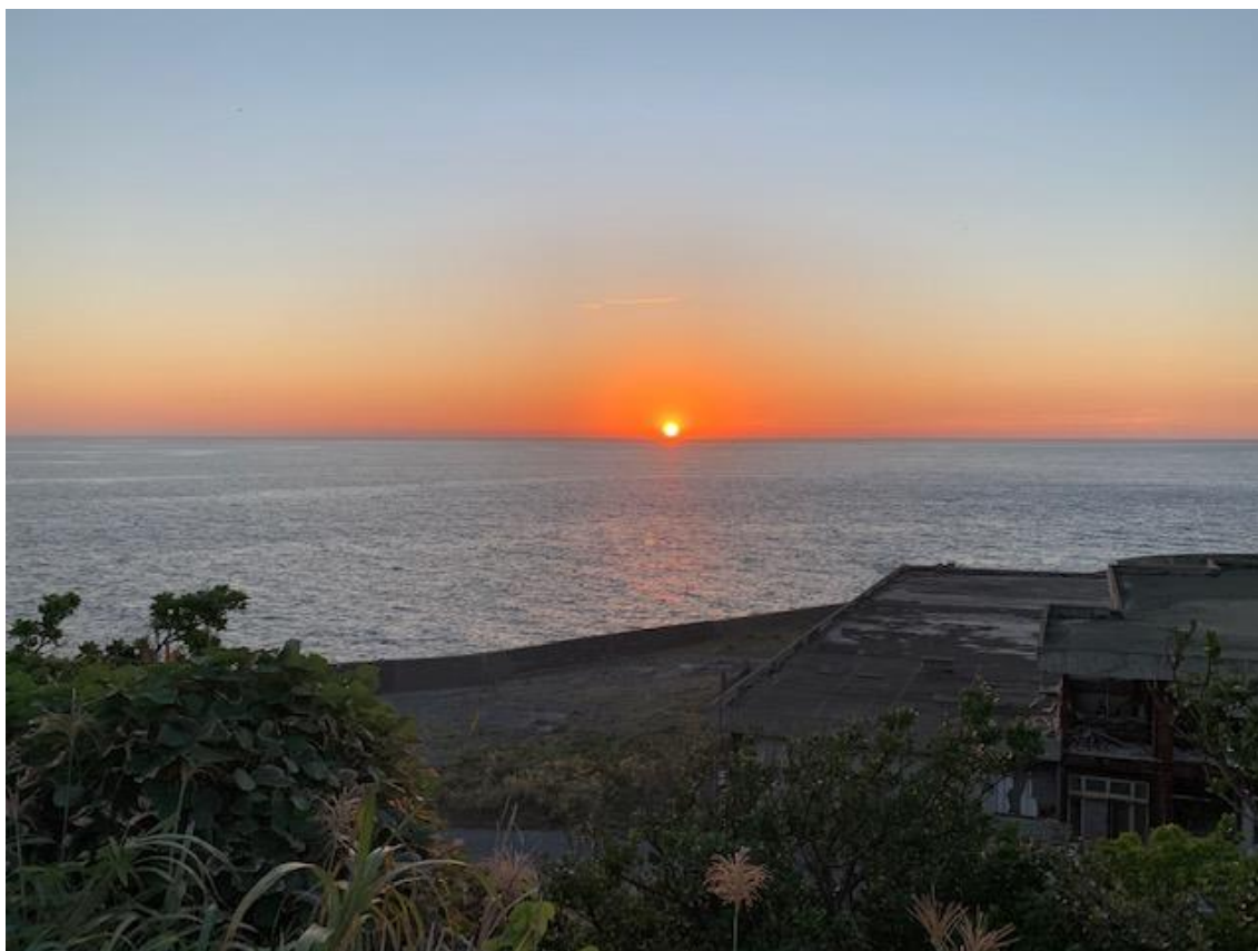
[ 高島の夕焼け ]

給食メニューに、「夕焼けごはん」がでたので、安直ですが、高島の夕焼けを載せました。