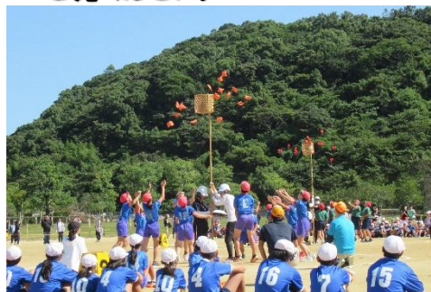
10/11 5・6年生小体会 練習の成果を発揮し、堂々と戦いました。