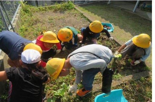
10/26 1・2年生 芋ほり 芋を見つけるたびに、大きな歓声があがっていました。