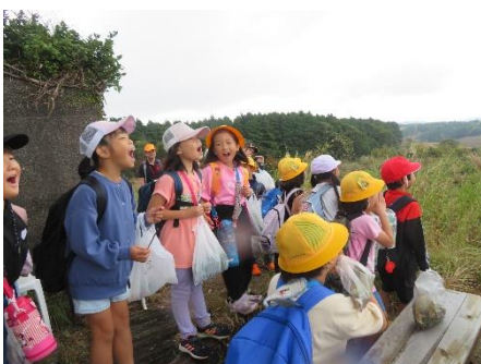
10/20 1・2年生あぐりの丘遠足 秋を探しながら、一日満喫しました。