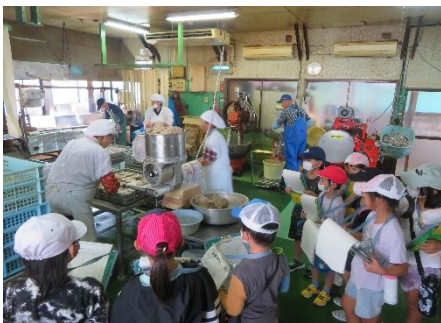
10/3,10 2年生式見町探検 たくさんの場所にお邪魔しました。