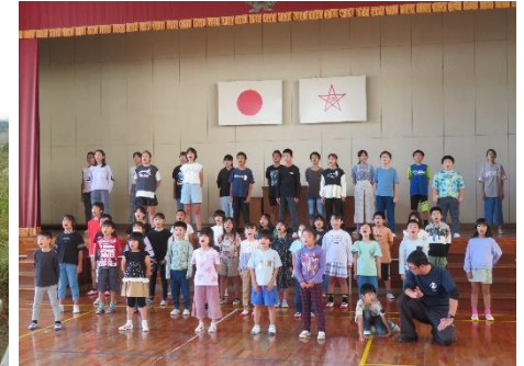
10/24 ふるさと祭り練習 本番に向け、全校で校歌の練習をしました。