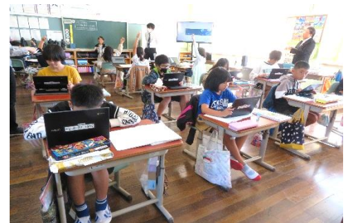
10/19 3・4年生算数複式研究授業 先生方が参観し、複式授業について学びました。