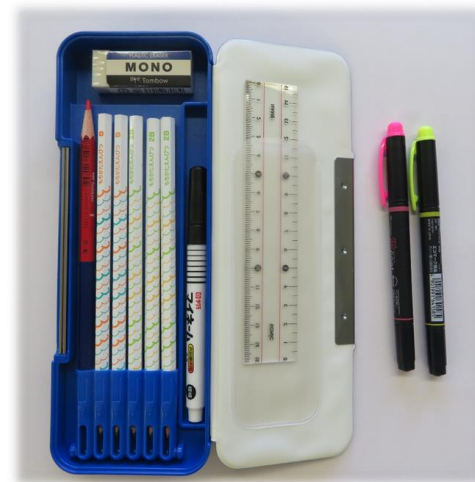
※入学説明会より（資料）