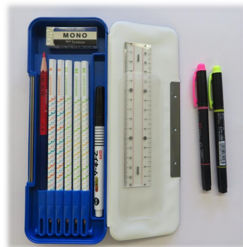
※入学説明会より（資料）