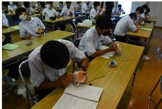
三川内焼 絵付け体験

8月の3年生に続き、2年生が県北への修学旅行に行ってきました。感染者が減少傾向であり、今回は宿泊もできました。生徒たちは「褒められる」だけでなく「叱られる」こともたくさんありました。そうやって一歩ずつ大人に近づいていきます。2年生はこの経験を次に生かしてください。