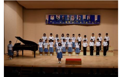
合唱コンクールの様子

10月23日が二十四節気の一つ「霜降」でした。「そろそろ霜が降る季節になっていく」という意味ですが、まだまだ、「霜」の季節はもっと後になりそうです。今年は、いつもより少し遅めの「金木犀（きんもくせい）」に秋を感じながら、最初の話題は「芸術の秋」です。