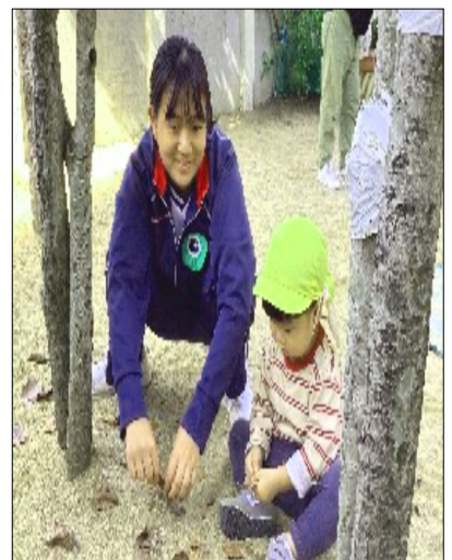
3年保育園実習から