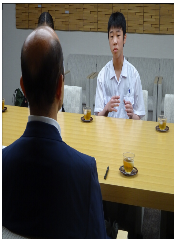
いわき市報告会 市長表敬 頑張りました。

「国民の祝日に関する法律」という法律で決められています。その法律には、「文化の日」は「自由と平和を愛し、文化をすすめる」と書かれています。「自由と平和」は何となく分かると思いますが、「文化をすすめる」とはどういうことでしょうか。