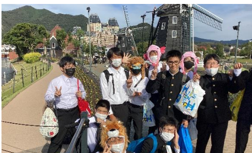
おみやげたくさん！yさん、Rさん、Kくん！