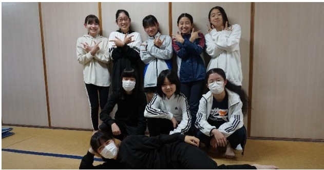
みんなで楽しい夜を過ごしたKさん！最高の笑顔で。