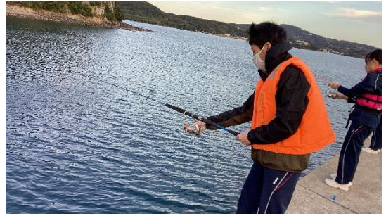
22匹釣ったぜ〜！ やったー！ Yさん