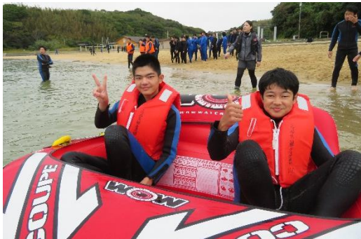
ビスケット！カッコいいだろ〜決めポーズのKさん！