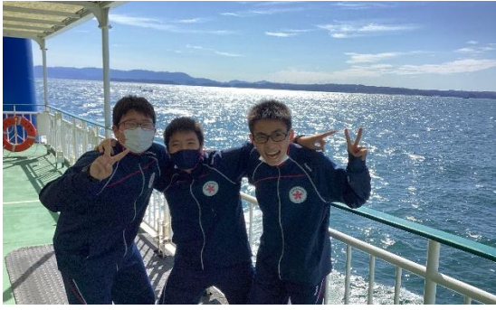
フェリー乗船！最高の景色と最高の笑顔。Rさん