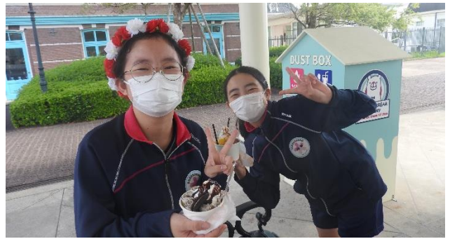
ハウステンボスのスイーツ、これがKさんおすすめ！