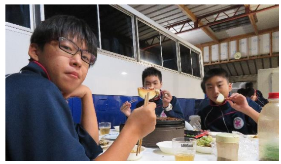
バーベキュー、おいしかった！Tさん大満足！