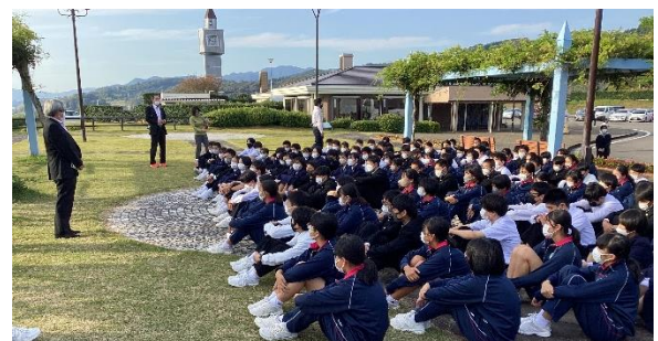
2泊3日みんなよくがんばりました！！