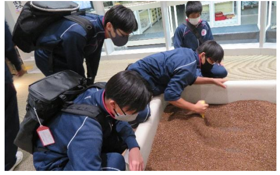
一支国博物館 発掘体験見つけたかな？ Tさん