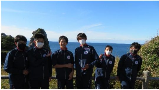
Kさんの陰に 猿岩！見えるかな？