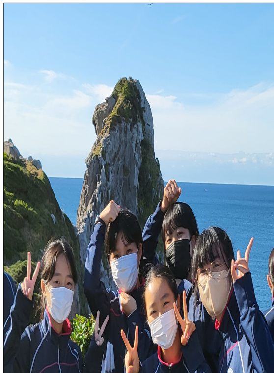
猿岩でのショット。対馬が見えました！

今年度の修学旅行のテーマは、『 森学NATUR 修学旅行ルールを守って礼儀正しく生活する』でした。「特定の人だけが楽しむ