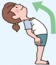
上半身を 後ろへそらす