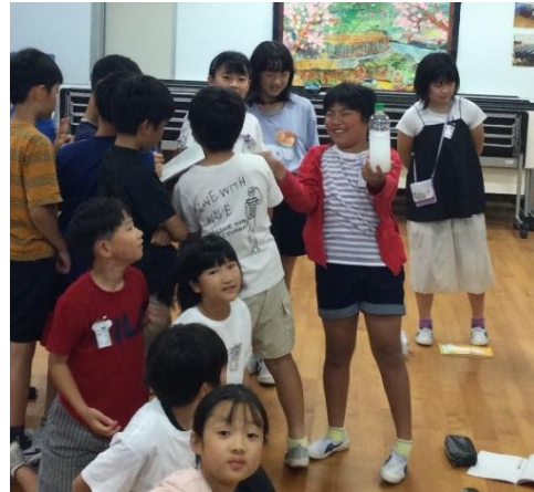
水に溶けるか？溶けないか？実験