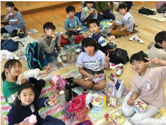
うれしい お弁当の日（＾＾）