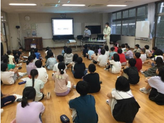
6月 水道局の出前授業！