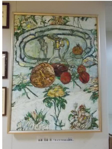
後藤忠雄「キャラフのある静物」