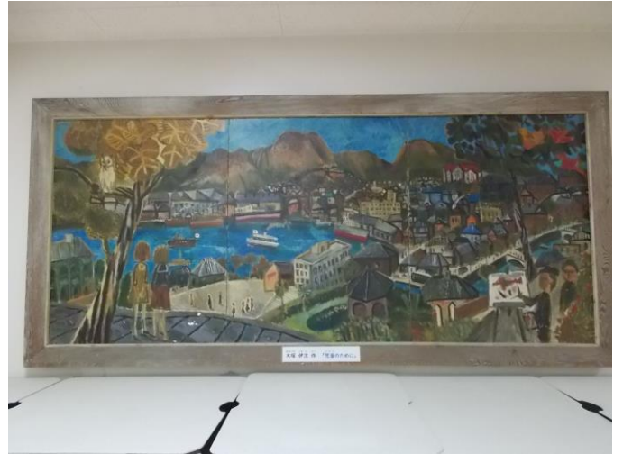
大塚伊次「児童のために」