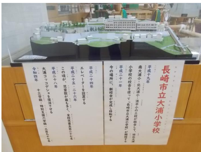
大浦小学校の校舎模型