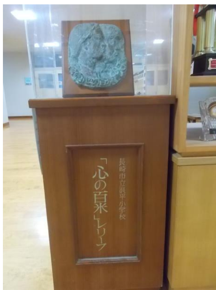
心の百米 (100m) レリーフ