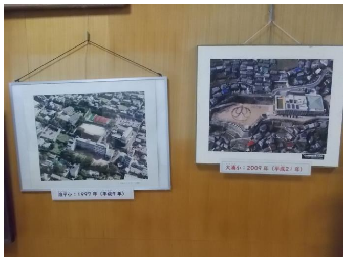
平成時代の航空写真 (左：浪平小 右：大浦小)