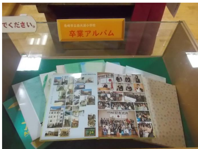
卒業アルバム：南大浦小