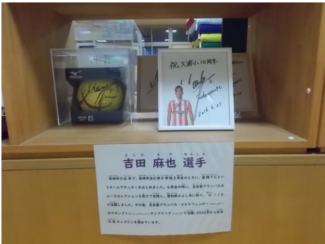
吉田麻也選手のサイン入りサッカーボール・色紙