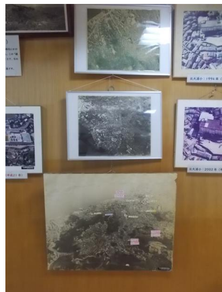
昭和～平成時代の 大浦地域の航空写真