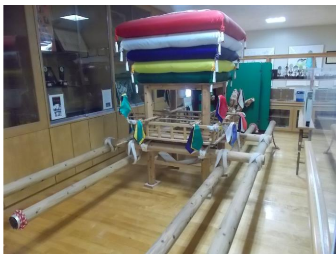
大浦小コココデショ