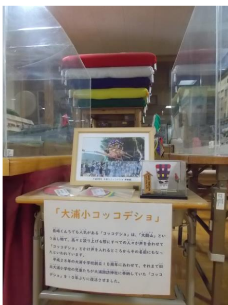
大浦小創立10周年のときに 10年ぶりに復活しました