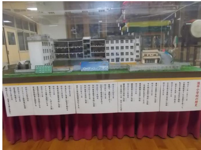
浪平小学校の校舎模型