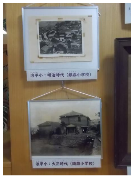
浪平小：明治・大正時代の写真