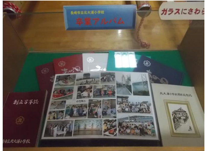
卒業アルバム：北大浦小