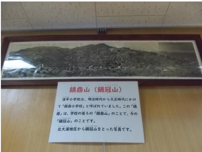
鎮鼎山 (今の鍋冠山)