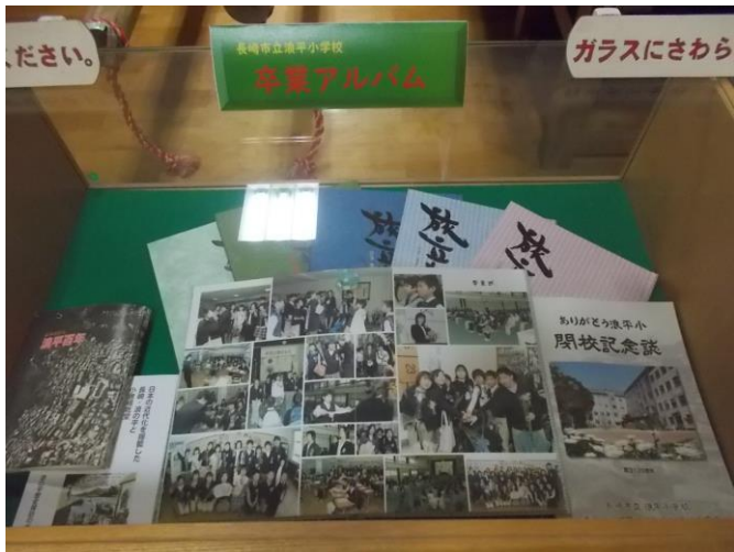
卒業アルバム：浪平小