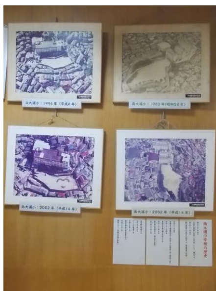
昭和～平成時代の航空写真 左：北大浦小 右：南大浦小