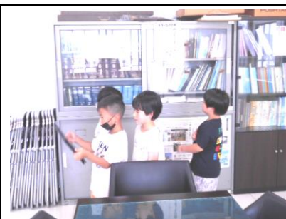
1年生 校内たんけん