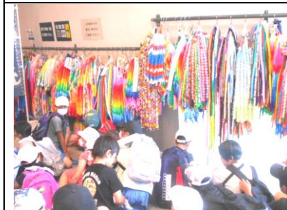
5年生 科学館・原爆資料館見学