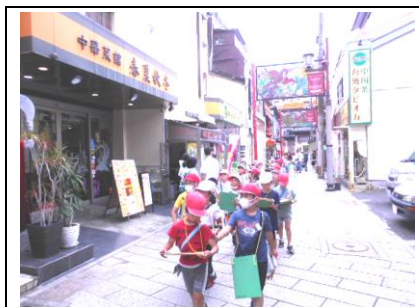
2年生 まちたんけん