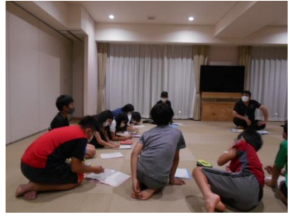
班長会議・反省会