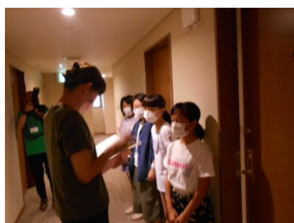
検温・朝の健康観察

2日目はホテルを跡にして、ハウステンボスに行きました。途中雨がパラつくこともありましたが、子供たちはグループで計画的に活動していました。楽しい思い出がたくさんできました。