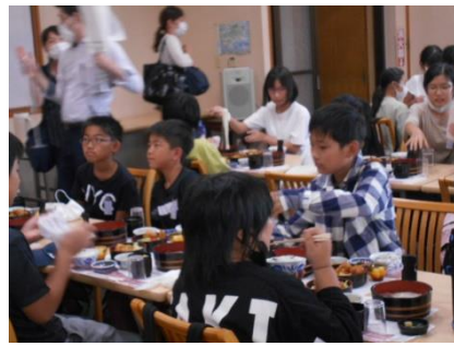
みずなし本陣屋食