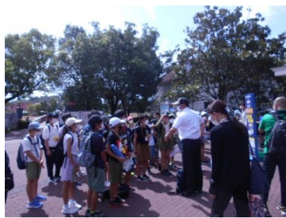
ハウステンボス到着