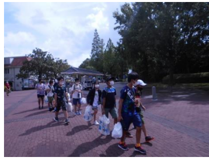
滞在5時間、しっかり遊びました