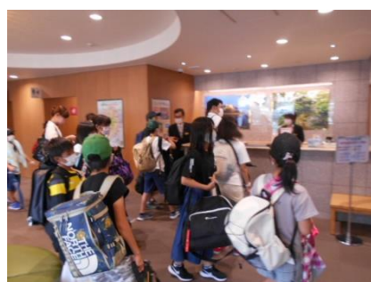
ホテル退所 ハウステンボスへ