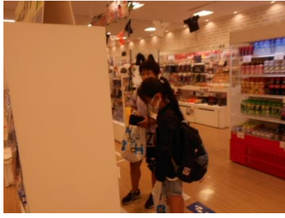
みやげ買い「自分へのご褒美…」