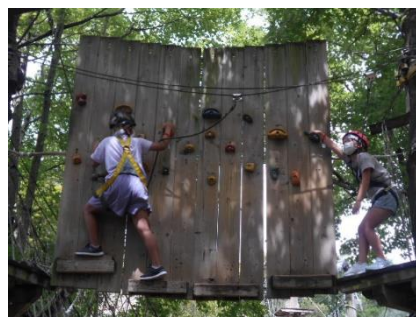
クライミングに挑戦!