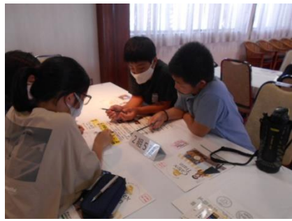
鉄道クイズに挑戦