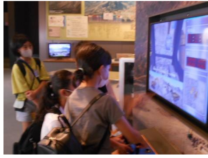
がまだすドーム見学