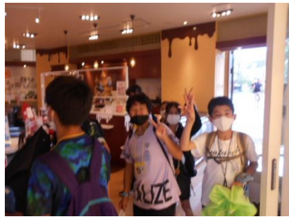
「昼ご飯 どこで食べようかな?」