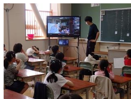
他学年はテレビを見ながら活動

今回のテーマは、「天気」です。ライアン先生の発音に合わせて、晴れ「sunny」、曇り「cloudy」、雨「rainy」などの基本的な天気の言い方を練習した後、簡単なゲームをしました。今回は、「晴れときどき曇り」など、少し難しい表現も教えていただきました。ちなみに、「晴れときどき曇り」は、英語で「partly cloudy」と言うそうです。