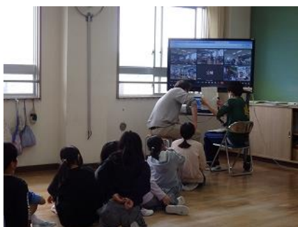
今回は6年生教室からの放送です