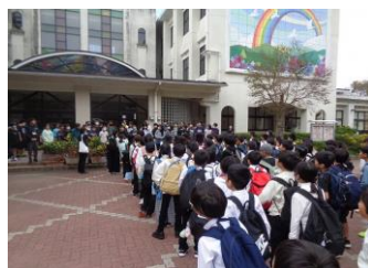
鳴見台小のみなからのお見送り