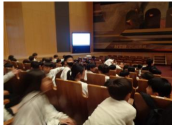
ブリックホールの客席での様子