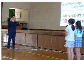
児童代表のお礼の言葉