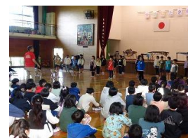
ステージ発表 4年1組 演奏