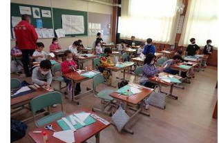
ふれあい広場 ハタづくり