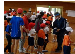
じゃんけんゲーム