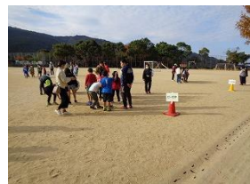
ふれあい広場 ビー玉遊び