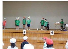
「パセロリサラダ」模範演技