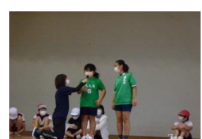
「6年生からひとこと」