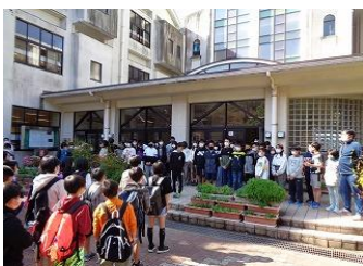
出発の時のお見送り

11月9日(水) 午後に小音会に出場しました。4年1組は「風のメロディー」「チャレンジ」を合唱し、4年2組は、「スーパーカリフラリストミック エクスピアリドーシャス」を合奏しました。ブリックホールにすてきなハーモニーを響かせました。本当に素晴らしい演奏でした。