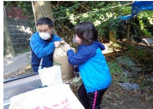
写真は、11月7日(月)のもみすりの様子です。