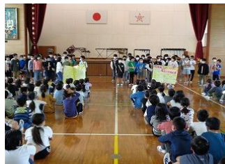
応援のメッセージ渡し