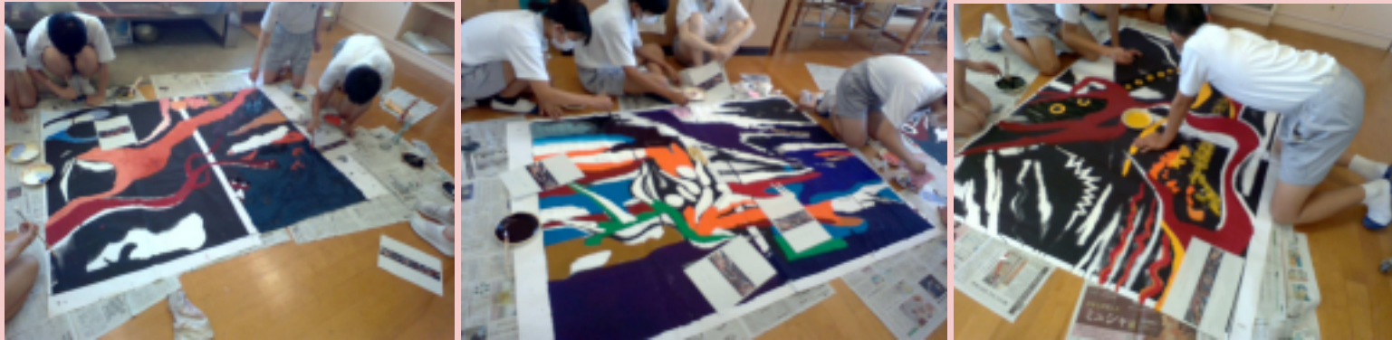
↑長中生によって制作されている 岡本太郎の絵