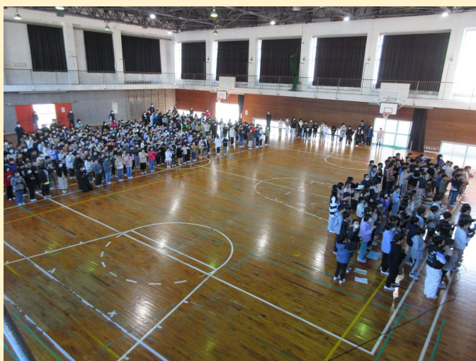
世界が1つになるまで(手話を交えて歌いました。)