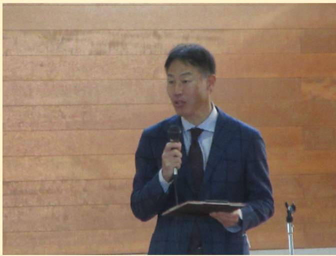
自分も友だちも大切にできる村松っ子になろう。