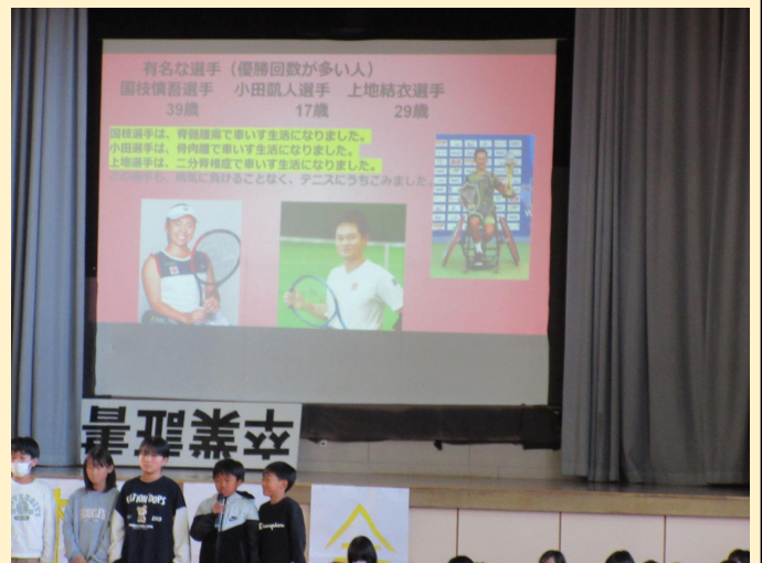
4年生発表(パラスポーツで頑張っている人たち)