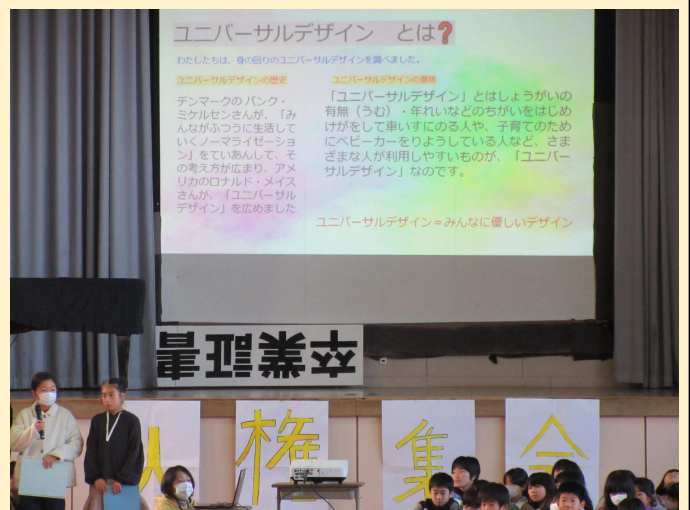
4年生発表(ユニバーサルデザインって何?)