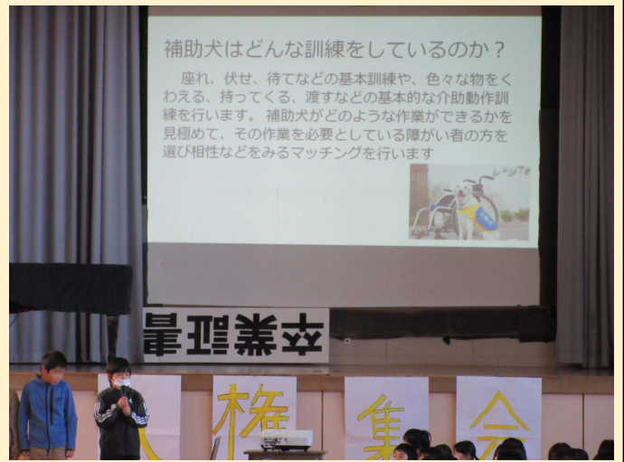
4年生発表(体の不自由な人を支える動物たち)