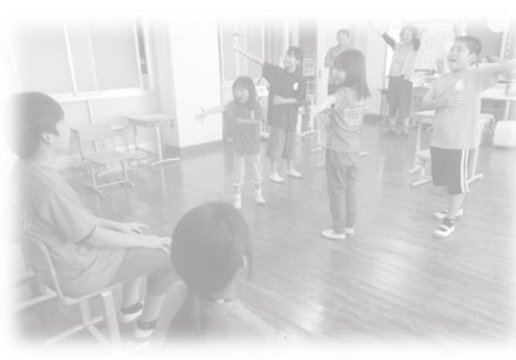
励ます会での応援の様子 10月4日

南小として最後の小体会への参加です。1～4年生や先生たちの応援を受け、6年生は走り幅跳び、5年生は100m走にエントリーしました。6年生の さんは、3m24cmの好記録で見事1位を獲得しました。他の2人も全力を出し切りました。始業式で、「本番の結果だけではなく、本番まで何をやってきたかが大切だ」と話をしていました。3人とも1cmでもよい記録を、0.1秒でもよい記録をとという気持ちで、本気で取り組みました。その姿が何より輝いていました。本番、大舞台で力を発揮できた、発揮できなかったはありますが、本気で取り組んできたからこそ、心から嬉しいし、心から悔しいのです。こうした経験の積み重ねが本物の成長につながります。