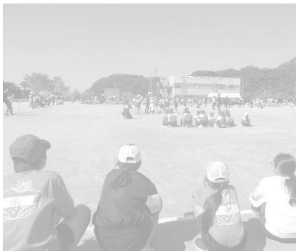
茂木小の球入れの応援!