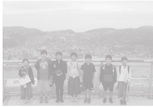
市街が一望できる稲佐山展望台