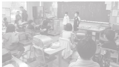
今回もお世話になりました

パン屋さんのおくには工場がありました。そこでおいしいパンをたくさん作っています。