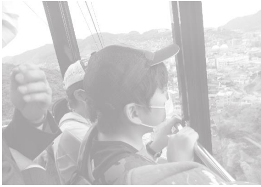
ロープウェイからみる絶景