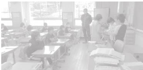
茂木小3年生にひまわりの種プレゼント

2年生のさんは、生活科の町たんけん、茂木小の仲間といっしょに茂木地区のお店や施設をまわりました。進んで質問するなど、グループの中でもしっかり活躍していました。