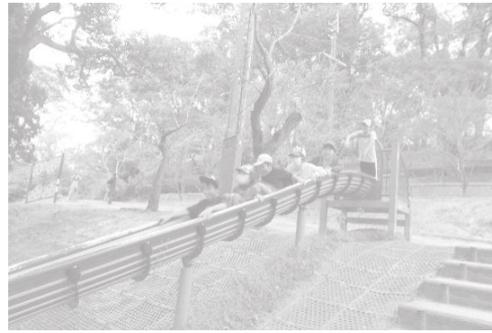
楽しく遊んだ稲佐山公園