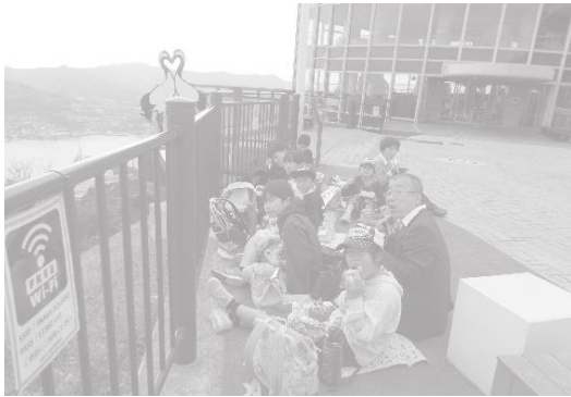
みんなでおいしいお弁当