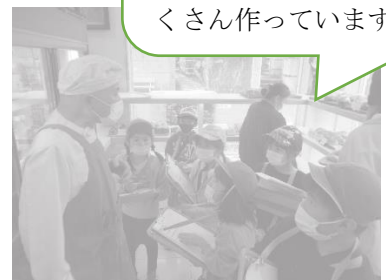
2年生活科「町たんけん」郵便局、お菓子屋、パン屋、など、いろいろな場所をたんけんしました。