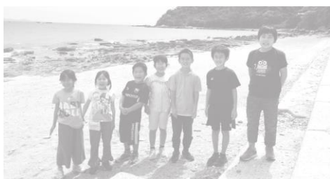
集合写真 笑顔が光る南の七つ星

宮摺の自治会長様には公民館のトイレを貸していただきました。たいへんお世話になりました。