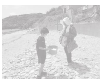
地域の方とのふれあい