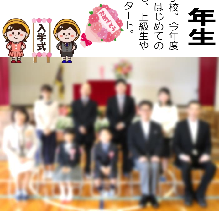
二人の新1年生を囲んで、担任（前列左）、教頭（前列右）と保護者の皆様

入学をお祝いして、在校生と中学生からは、「よさこいソーラン節」の祝いの舞がありました。マスクで息苦しかったと思います。が、全力の演舞に会場からは拍手喝采でした。