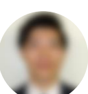
新メンバーの二人

※本校のような小規模校では、法律で決められた教員定数の関係で、小学校は担任だけ（音楽や理科などの専科が入らない）、中学校は、教科免許をもった教員がいらないという状況になります。そこで、日吉中学校に協力いただき、音楽と家庭の先生を派遣いただきました。具教委から数学、社会、美術の講師を配置いただきました。その他、本校中学校教員も全員小学校の授業に乗り入れます。まさに、全教職員総出ですべての子どものための教育活動に当たっていきます。