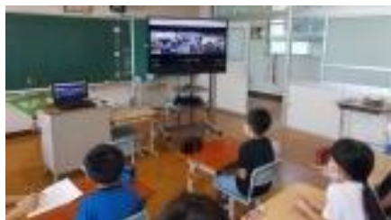
大注目の自己紹介

遠く離れた学校の仲間といっしょに学習する。つい何年か前までは考えられなかったことですが、こうしたことが普通に行われる世の中になってきています。オンライン学習は本校のように少ない人数の学校には特に有効です。今後の可能性を大いに感じた1日でした。