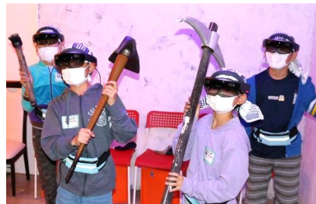
軍艦島デジタルミュージアムのVRプログラムでバーチャル体験

それは、「明治日本の産業革命遺産(世界文化遺産)」の端島(軍艦島)を訪れました。幕末から明治にかけて、西洋技術を進んで取り入れ、短期間に近代化を成功させた日本。特に重工業分