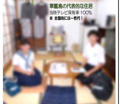
軍艦島の代表的な住居 当時テレビ保有率 100% ※ 全国的には一桁代!