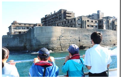
軍艦島を目の前にし、その壮大さに息をのむ子どもたち