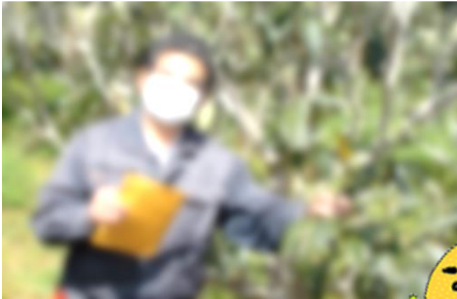
農協の さんに指導をいただきながら