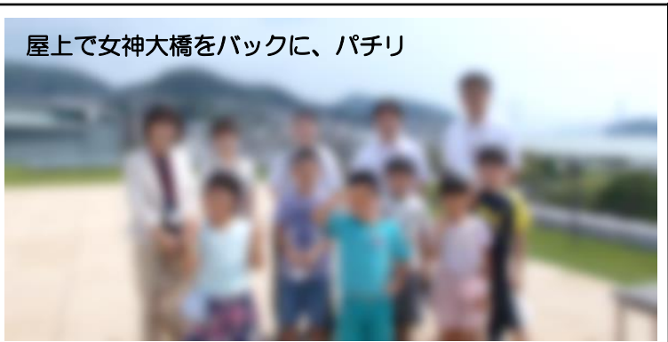
屋上で女神大橋をバックに、パチリ