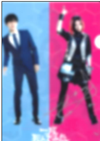
広瀬すずさんの直筆サイン