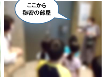
ここから 秘密の部屋