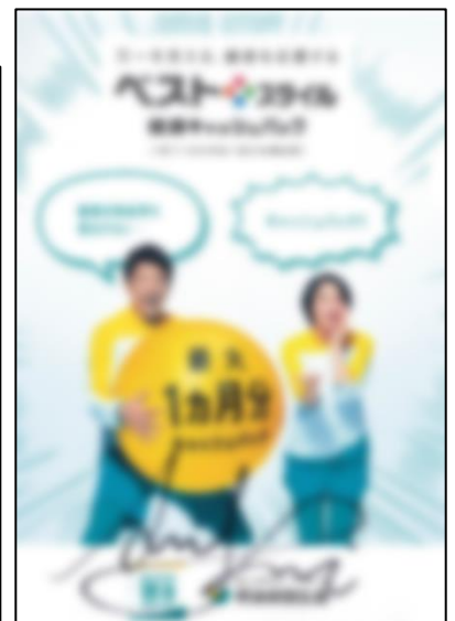
広瀬アリスさんの直筆サイン