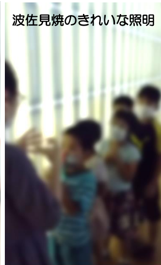
波佐見焼のきれいな照明