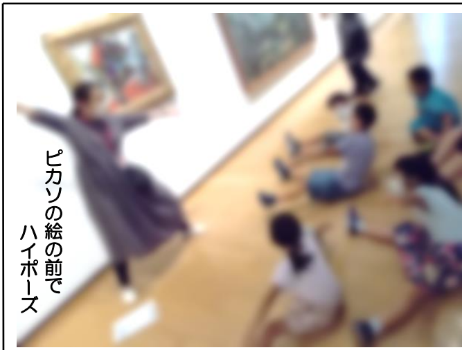
ピカンの絵の前で ハイポーズ

◎8/8(土)に小学生が作った平和キャンドルが、平和公園に飾られ、灯がともされます。お近くを通られ方は、ぜひ幻想的な光を観覧ください。