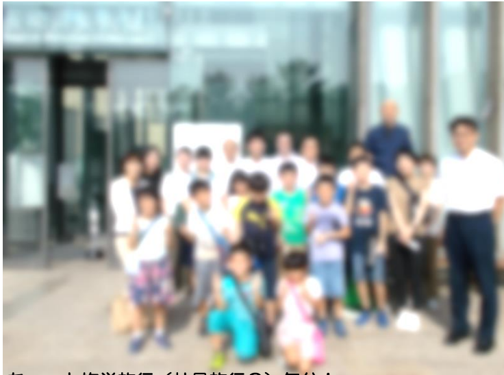
ちょっと修学旅行(社員旅行?)気分!