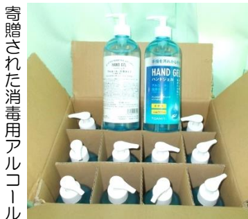
寄贈された消毒用アルコール

同小学校校歌の歌詞「国の宝の 生命はくむ」を思わず口ずさんでしまいました。本校のみならず、長崎市内のすべての小中学校に贈っていただいているそうです。第二波に備え、子どもたちと共に大切に使用させていただきたいと思えます。