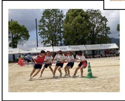
2年生学年種目 ぐるんぐるん・ゴ～