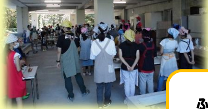
ぶくの皮を使って すい身を作りました!