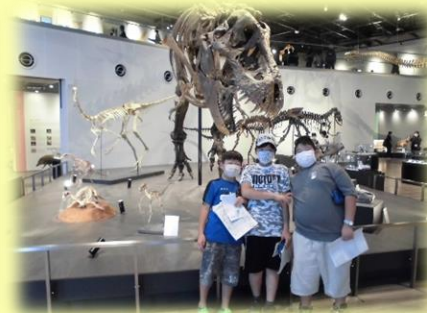
ティラノサウルスの化石・・・大きかったあ