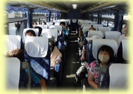
出発式はみんながお見送りしてくれました！