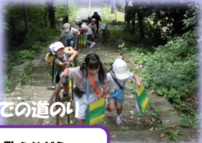
円福寺までの道のり