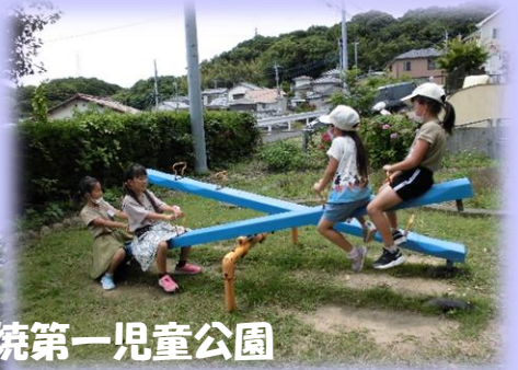
香焼第一児童公園