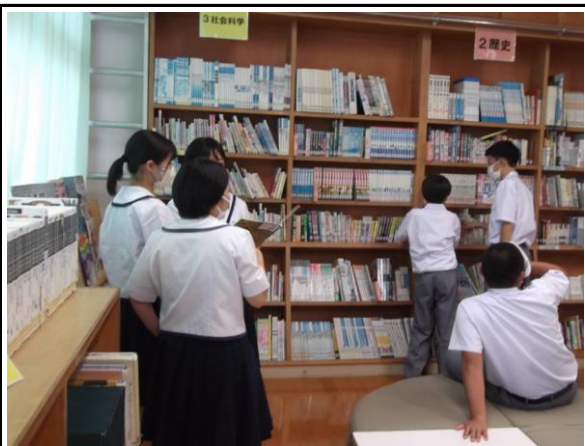
ちょっとリラックスしたり、 友達と本の感想を言い合ったりします。