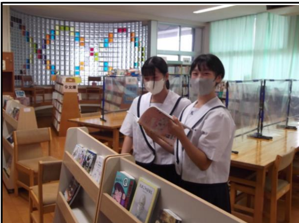
2冊まで借りられますので、 真剣に本を選んでいきます。