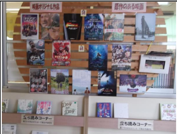
映画に関する人気作品などの 立ち読みコーナーが好評です。