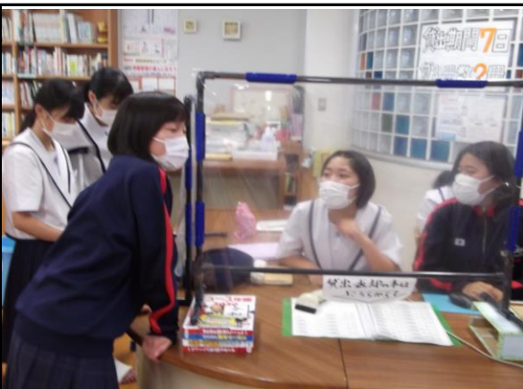
借りる本が決まったら 文化図書委員が手続きをしてくれます。