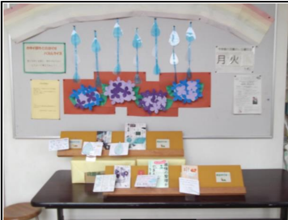
図書室前の廊下には、 様々な本の紹介がしてあります。