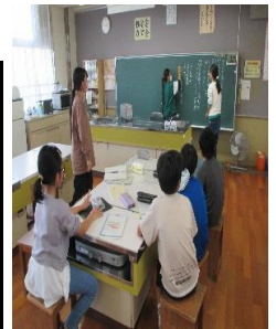
運営委員会の活動の様子から

○11月8日の立冬を過ぎ徐々に、日中の気温も下がってきました。これから、本格的な冬を迎える季節となってきました。2学期は、様々な学校行事が行われます。この活動の中で子どもたちのよさを見ることが多くあります。学校行事ごとに学年の役割分担があります。会の司会や代表の言葉、掲示物の準備、入退場の準備などいろいろあります。このような活動の様子を見ているとどの学年も主体的に協力して行動する態度を見ることが多くなりました。本校の児童像「みがき合い やさしい子」の実現に年々近づいているように感じます。先日、ある自治会長さんからお電話をいただきました。内容は、10月22日に行われた「さざなみ会館まつり」に本校の1・2年生が参加して小音会で歌う曲を2曲披露したことに対してでした。この時の子どもたちの歌声を聞いてすごくよかったというお話を自治会の方から受けて学校に連絡して下さったものでした。このことは、本校職員、子どもたちにも伝え喜んでいました。この件を受けて学校は地域とともにあることを再確認したところです。