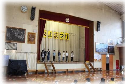
5年生 宿泊体験学習に行ってきました。