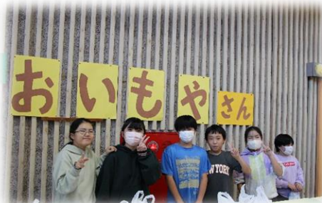
サツマイモの販売は完売しました。1・2年生 ころを一つにえがお100%