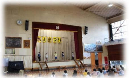
3年生 少年少女冒険隊