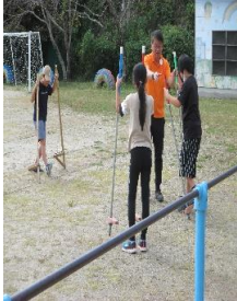
竹馬で遊ぶ 子どもたち

○10月に入り気温も下がり過ごしやすいい日々となってきました。2学期が始まりまもなく2か月が過ぎようとしています。子どもたちに関する行事がたくさんある2学期ですがどの学年の子もこの行事を楽しみにしています。これまで、5年生の科学館、原爆資料館見学や3年生の西彼農業高校との交流学习、6年生の書道体験、4年生の琴の浦荘見学、社会科見学、6年生の小体会、1・3・6年生の芋ほりなど2学期前半でもたくさんの行事がありました。後半も「形上まつり」や「小音会」「交歓会」「修学旅行」「人権集会」などまだまだたくさんの行事が控えています。これからは各行事に向けて子どもたちと頑張っていきたいと思えます。また、現在のところ、心配された新型コロナウイルス感染症やインフルエンザの蔓延は本校では起きていません。しかし、これから寒くなる季節を迎えますので安心はできません。これまで以上に感染予防に努めていきたいと思えますので御家庭でも御協力をお願いします。