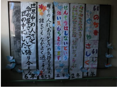
各学年の平和標語から

○今年の2学期は、67名全員揃ってのスタートとなりました。まだ、残暑が続いていますがこれから、徐々に涼しい季節に移行していき、学習や運動に取り組みやすい季節になっていきます。地域でも、「形上地区まちづくり計画」がスタートし2学期は形上地区でも様々な行事が予定されています。詳細については、後日プリント配付がありますのでそちらをご覧ください。形上小学校も「わがまち形上」の一員です。形上地区の行事に一人でも多く参加し協力していければと思います。宜しくお願いします。9月の2週目から6年生の子どもたちは長崎市小学校体育大会に向けたバスケットボールの練習を始めています。13名の子どもたちが心ひとつにして頑張る姿は素晴らしいですね。