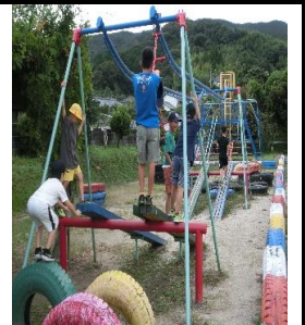
休憩を取りながら遊ぶ子どもたち

○今年の2学期は、67名全員揃ってのスタートとなりました。まだ、残暑が続いていますがこれから、徐々に涼しい季節に移行していき、学習や運動に取り組みやすい季節になっていきます。地域でも、「形上地区まちづくり計画」がスタートし2学期は形上地区でも様々な行事が予定されています。詳細については、後日プリント配付がありますのでそちらをご覧ください。形上小学校も「わがまち形上」の一員です。形上地区の行事に一人でも多く参加し協力していければと思います。宜しくお願いします。9月の2週目から6年生の子どもたちは長崎市小学校体育大会に向けたバスケットボールの練習を始めています。13名の子どもたちが心ひとつにして頑張る姿は素晴らしいですね。