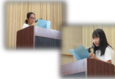
始業式での児童代表の言葉(5年生)

○42日間の夏休みも終わり今日から2学期がスタートしました。今年の夏休みは毎日、30度を超える日が続き校区内の巡視をしても子どもたちの姿をみる事がほとんどできませんでした。しかし、この夏休み期間中に子どもたちに関する事件事故の報告もなく本日、2学期の始業式を迎えることができました。本日の始業式では、2学期に向けて2つの話をしました。一つは、毎日の生活に目標をもって頑張る子になって欲しいということ伝えました。もう一つは、本校の重点目標である「考える子」「みがき合い やさしい子」の達成に向けた行動を取れる子になりましょうという話をしました。とくに「みがき合い やさしい子」の育成については、1学期に様々な場面で見ることができました。この調子で2学期も1年間の目標達成に向けて頑張ってくれることを期待しているところです。2学期は様々な行事が予定されています。保護者の皆様や地域の皆様に御協力や御支援いただくことも多いと思いますが2学期も宜しくお願い致します。