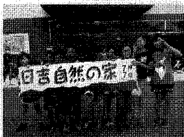
宿泊体験学習から(5年生)

○子どもたちが待ちに待った夏休みが明日から始まります。心配された新型コロナウイルスやインフルエンザの感染症も子どもたちに広がることなく1学期の教育課程を修了することができました。1学期に行われた入学式・運動会・宿泊体験学習と大事な学校行事も滞りなく進めることができてよかったです。また、この他にクラブ活動では地域の方々に、読み聞かせや総合的な学習の時間では保護者の方々や地域の方々、地域の施設の方々に、さらに社会科では上下水道局の方々に来校いただき授業を進めてきました。形上小学校では、実際に現地に行ってみ学することがなかなかできないのでこのようにゲストティチャーとして学校に来ていただくことはすごくありがたいことです。2学期も各学年ごとに地域の方々や関係機関と連携を図りながら学習の質を高めていきます。明日からの42日間の夏休みが子どもたちにとって、有意義かつ思い出に残る夏休みになればと思っています。