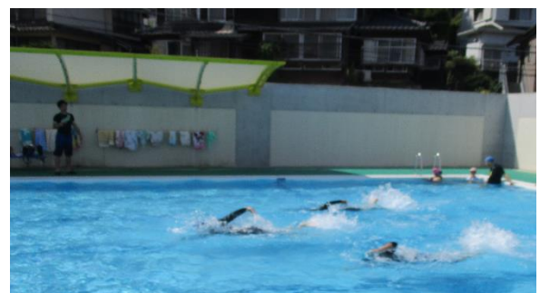
水泳指導も始まりました！