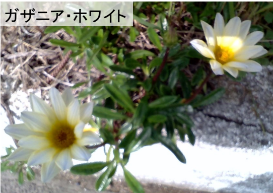
ガザニア・ホワイト