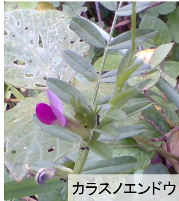
カラスノエンドウ