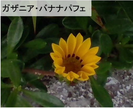
ガザニア・バナナパフェ