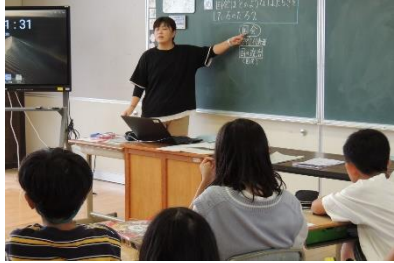
六年一組の社会科授業を担当する六年二組の 教諭

中学校では、教科専門の教員による教科担任制が主流です。しかし、小学校でも外国語や情報教育といった新たな学びが始まっており、教師は新たな専門性が求められます。また、教師も人です。得意・不得意があります。さらに、一人一人の子どもたちにとっても、担任