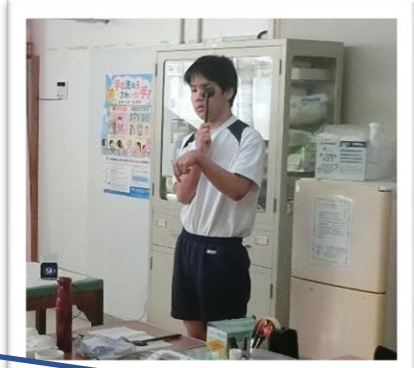
体位測定&保健指導がありました！