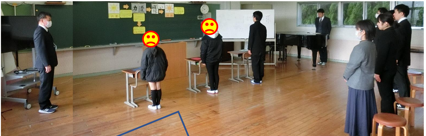
三学期始業式 心も体も すばらしい構えです！

たいいそくてい 1/9(火) 体位測定 ①あいさつ(始まり) せつめい ②先生からの説明 しんたいそくてい じゅんぱん ③身体測定(順番) 中2 しんちょう たいじゅう しりよく 身長→体重→視力 小5 しりよく しんちょう たいじゅう 視力→身長→体重 小3 たいじゅう しりよく しんちょう 体重→視力→身長 てあら ④手洗いチェック！ お ⑤あいさつ(終わり)