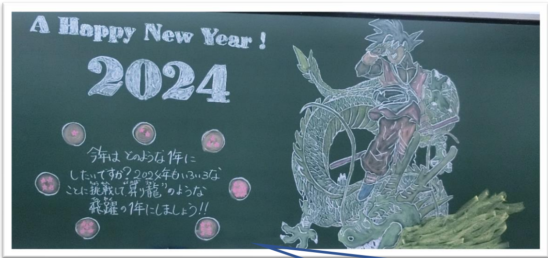
中学校学級開き 「飛躍の一年に」